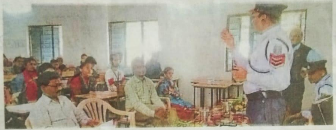
पत्रिका न्यूज नेटवर्क